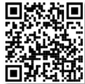
Element im Google Play Store