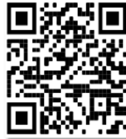
Element im Apple App Store

Mit einem QR-Code Scanner den entsprechenden QR-Code scannen und installieren!